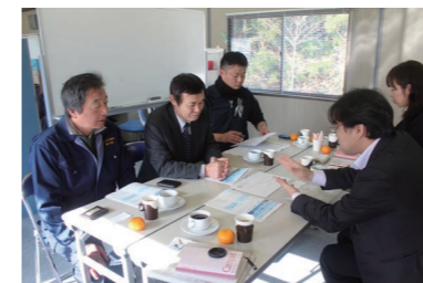
プロジェクトの報告をし、皆様のあたたかいメッセージをお渡ししました