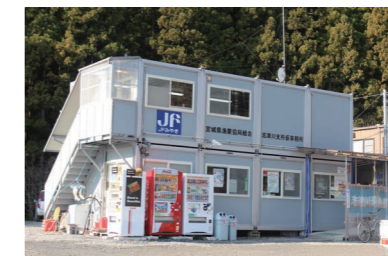
宮城県漁業協同組合志津川支所。事務所が被災したため、仮事務所での運営