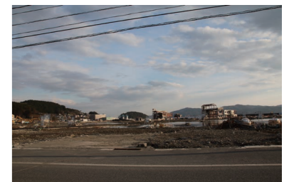
2012年12月の町の様子。復興はまだまだこれからです