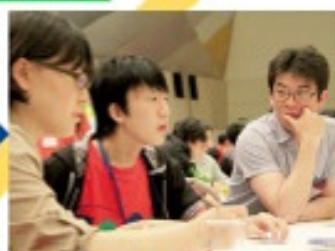
2012年5月 第2回 子どもとおとなと一緒に話し合い