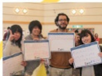
2014年5月 第5回 復興に向けて、子どもおとなも声をあげ!