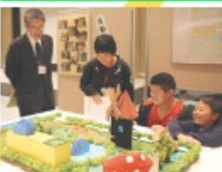
2011年11月 第1回 「夢のまちプラン」を発表!