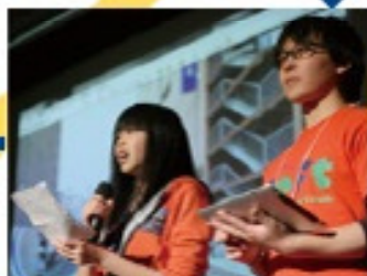
2013年5月 第4回 「夢のまちプラン」を実現してきた活動を発表