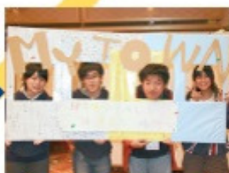
2012年12月 第3回 東北内外の子ども同士で話し合い